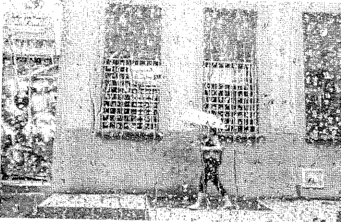
PREVISÃO da Funceme para Fortaleza é de chuvas isoladas para os próximos dias