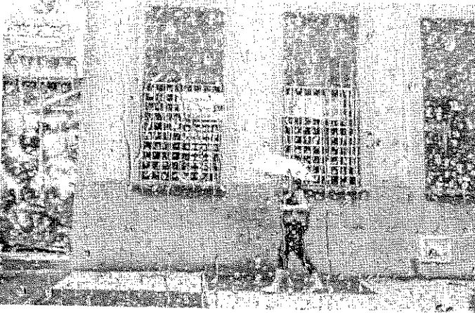
PREVISÃO da Funceme para Fortaleza é de chuvas isoladas para os próximos dias