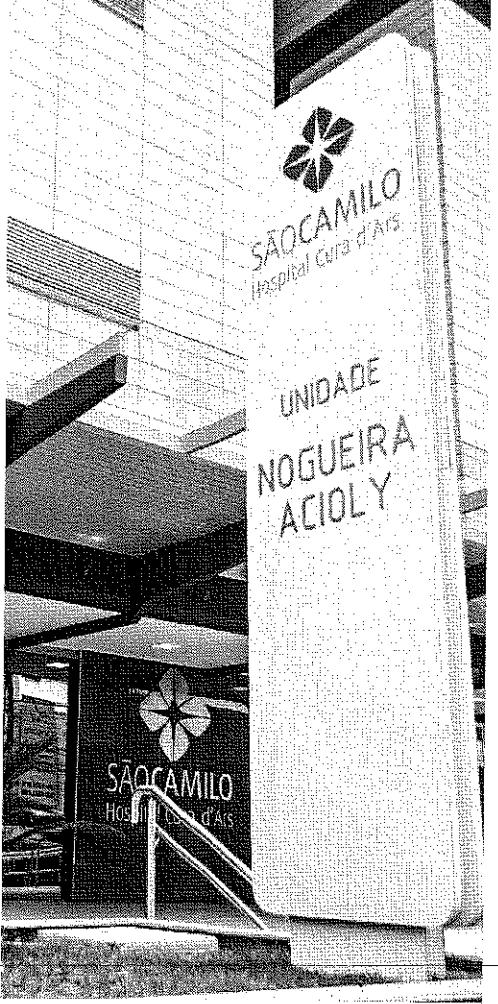
NA última segunda-feira, foram atendidos 133 pacientes com síndromes gripais no Hospital São Camilo