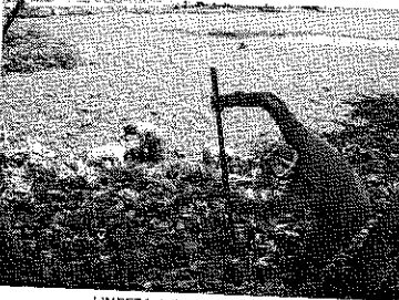
LIMPEZA do Lago Jacarey para remoção dos aguapés começou na quarta-feira passada