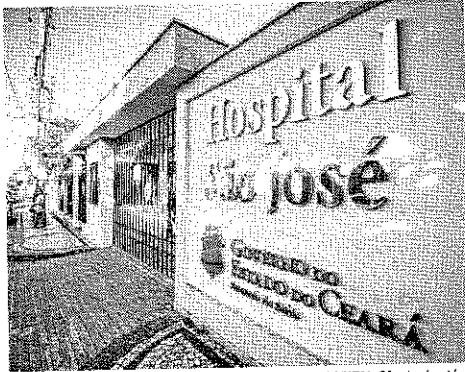
HOSPITAL São José está com a UTI lotada

"Foi um aumento muito específico, que nos deixa muito preocupados", relatou o gestor em vídeo publicado na rede