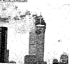
DESASTRE das Torres Gêmeas não teve contagem de mortes tão alta quanto o Brasil chega a contabilizar em um dia de pandemia

O que aconteceria com o governo de um país no qual ocorressem cinco onzes de setembro no intervalo de dez dias?