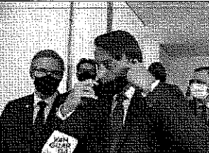
QUESTIONADO por não usar máscara em outras ocasiões, Bolsonaro arranca proteção do rosto; maturidade