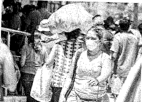
PARA 50% das famílias mais afetadas, a diminuição do valor do benefício será de até R$ 46, segundo números do próprio governo federal

Curca de 5,4 milhões de beneficiários da Bolsa Família podem não ser contemplados pela promessa de aumento no valor do benefício e teriam até uma redução após a substituição do programa pelo Auxílio Brasil, segundo simulações do próprio governo federal obtidas pela Lei de Acesso à Informação (LAI). O número corresponde a 37% dos 14,7 milhões de atuais beneficiários da política social.