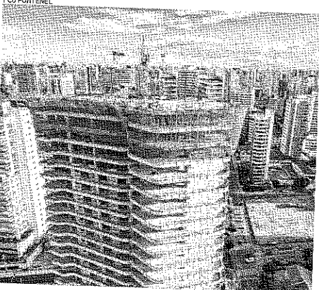
DENTRE os fatores que mais pesaram para alta, está o encarecimento dos materiais de construção