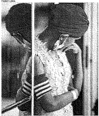
ASSOCIAÇÃO Peter Pan atende 60% de crianças do interior

GABRIEL DAMASCENO ESPECIAL PARA O PÓVO gabrieldamasceno@opovo.com.br