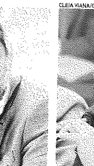
GOVERNADOR do Ceará, Elmano de Freitas