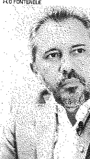
O MINISTRO da Educação, Camilo Santana