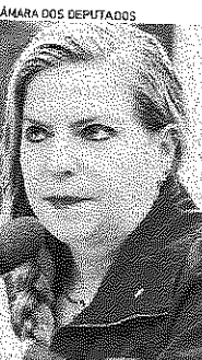
LUIZIANNE Lins é deputada federal pelo PT

O quadro, de acordo com essas fontes, seria de maior equilíbrio entre blocos, com mais presença de Camilo e do seu sucessor no Governo, Elmano de Freitas, além de outros atores importantes nessas trajetórias, como o próprio Guimarães.