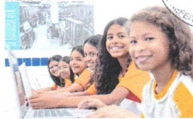
PROGRAMA busca levar conectividade para uso pedagógico nas escolas públicas