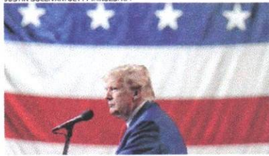
TRUMP recorrerá da decisão na Suprema Corte dos EUA

A Suprema Corte do Colorado emitiu ontem, 19, uma decisão que barra o ex-presidente americano Donald Trump de aparecer na cédula de votação das primárias do Partido Republicano, neste Estado, no próximo ano.