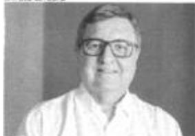
DANILO Forte é deputado federal