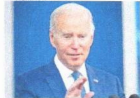
O PRESIDENTE dos Estados Unidos, Joe Biden