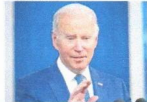
O PRESIDENTE dos Estados Unidos, Joe Biden