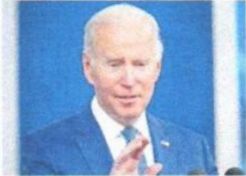
O PRESIDENTE dos Estados Unidos, Joe Biden