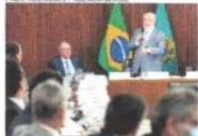
LULA coordenou primeira reunião ministerial de 2024, na segunda-feira, 18

A opção preferencial pela grandiloquência leva os governos a se encantar com a própria propaganda ou pelas caveiras de burco de administrações passadas.