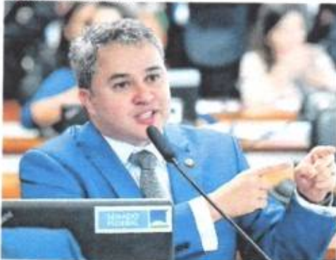
SENADOR Efraim Filho pediu celeridade na apreciação da proposta

A medida também trata, na avaliação de Efraim, maior segurança jurídica ao acordo. "O projeto de lei materializa aquilo que foi verbalizado pelos protagonistas da discussão sobre a desoneração, tanto pelo Ministério da Fazenda, quanto o Senado e os setores produtivos. O texto trata a desoneração permanecendo nos mesmos moldes em 2024, ou seja, sem nenhuma alteração, e a partir de 2025 teremos uma reoneração gradual e híbrida do imposto", afirmou.