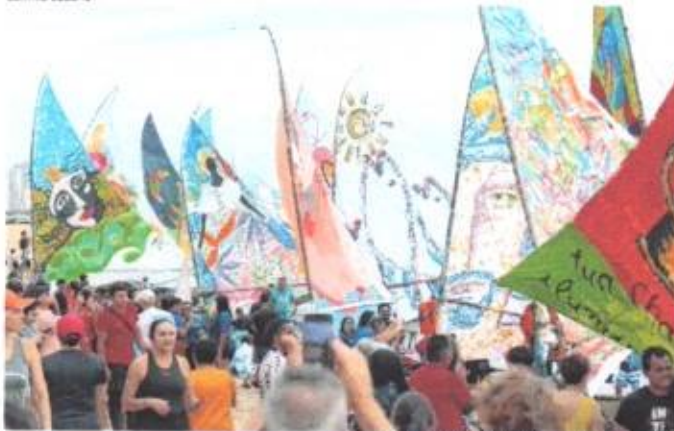
A TRAVESSIA da Aquavelas 2024, do Mucuripe à Barra do Ceará, teve 40jangadas participantes