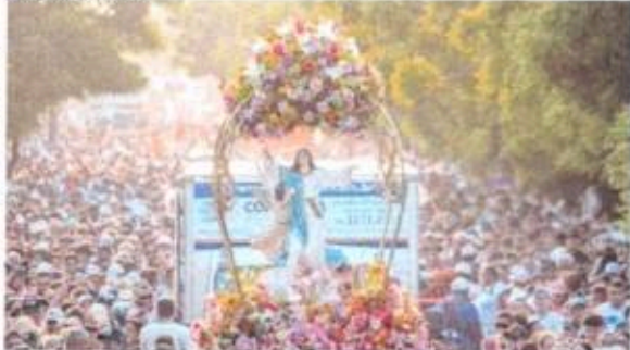
TRAJETO leva 12,5 quilômetros. Foi a primeira participação de dom Gregório Paixão, arcebispo de Fortaleza

Uma imagem religiosa foi carregada pelos fiéis durante a caminhada. O cortejo saiu do Santuário de Nossa Senhora da Assunção, no bairro Vila Velha, e chegou à Catedral Metropolitana de Fortaleza, no Centro.