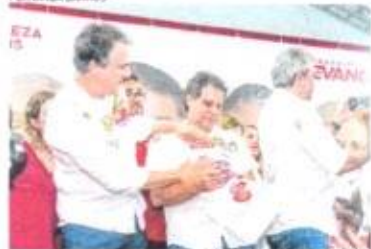
MINISTRO Camilo Santana e Evandro Leitão