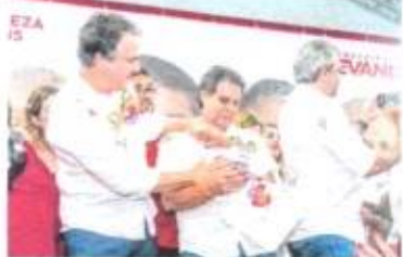
MINISTRO Camilo Santana e Evandro Leitão