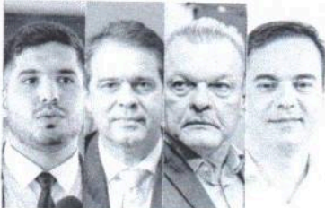
PESQUISA Quæst mostra dois blocos na disputa pela Prefeitura de Fortaleza