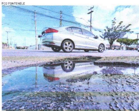
CRATERAS na av. Juscelino Kubitschek, no Passaré

Além desses dois, outras seis localidades com buracos foram visitadas pelo O Povo Vivo. Em todas, uma característica comum são os desvios dos carros, para evitar prejuízos causados pelos desníveis, como os presentes na rua Omar Paiva, no Alvaro Weyne e nos dois